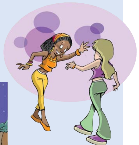
Fins la matinada poden...