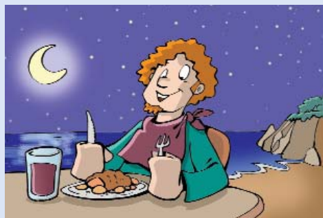
Quan es faci fosc poden...