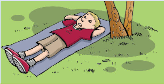
Després de dinar poden...