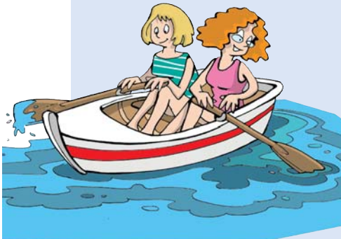
Al vespre poden...